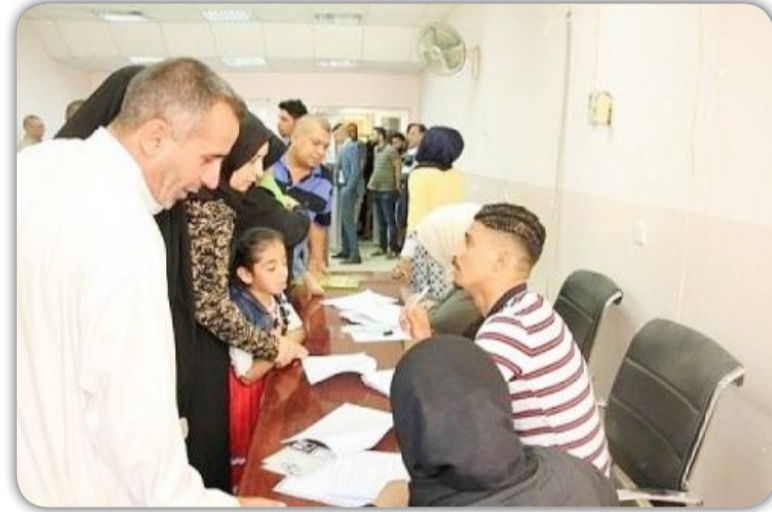
المعين المتفرغ من المدنيين لمحافظة بغداد بلغ ٥٨٢٨ □ مستفيدا وهي دفعة جديدة تم من خلالها شمول المستلمين خلال المدة الماضية وستكون الدفعات

اعلنت هيئة رعاية ذوي الاعاقة والاحتياجات الخاصة في وزارة العمل والشؤون الاجتماعية عن اطلاق دفعة جديدة من راتب المعين المتفرغ لمحافظة بغداد للمدنيين المشمولين بقانون هيئة ذوي الاعاقة والاحتياجات الخاصة رقم ٢٨٠ □ لسنة ٢٠١٣ في المركز العراقي الكوري وقال رئيس الهيئة القاضي اصغر عبد الرزاق الموسوي في بيان، ان "الدفعة الجديدة من راتب المعين المتفرغ للمدنيين سيتم المباشرة بتوزيعها ابتداء من يوم السبت المقبل بعد اكمال جميع الاجراءات اللوجستية والقانونية اللازمة لشمول المدنيين براتب المعين المتفرغ لمحافظة بغداد ليتمكنوا من استلام مستحقاتهم". واوضح ان "عدد المشمولين براتب