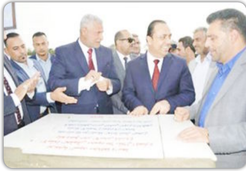
وضع الوكيل الإداري لوزارة النقل السيد أحمد عبد ايوب الموسوي، محافظة واسط وثلاثة محطات داخل

سدة الكوت وكذلك مجاور مسبح الكوت. وقال الموسوي: ان انشاء المرسى ومحطات التاكسي النهري جاء من اجل خدمة ابناء محافظة واسط، مؤكداً ان هذا المشروع يسهم بتوفير الراحة والترفيه للمواطن اضافة الى كونه اسلوب جديد وسريع للنقل بين ضفاف نهر دجلة وكذلك اسعاره المناسبة مقارنة بالوسائل النقل الأخرى. ومن جهته اشاد محافظ واسط السيد محمود الملاطال بجهود واداء شركات وزارة النقل وإسهامها بتقديم افضل الخدمات للابناء المحافظة. وكان برفقة سيادته مدير عام الشركة العامة للنقل البحري وعددا من السادة المسؤولين.