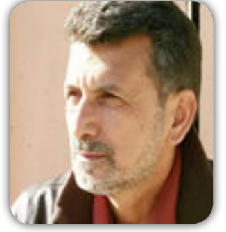
بقلم : عبدالرضا القرشي

صيف ٢٠١٤ لم يكن كأي صيف مر العراق كاد يكون كابوسا لا ننسوه منه الى يوم يعثون لولا تدخل المرجعية المنتملة بسماحة السيد علي الحسيني السيستاني بفتواه الفريدة من نوعها عبر تاريخ الشيعة الطويل الحافل بالظلم والاستبداد والقهر والتهميش والتغييب و... والتي لاقت استجابة متوقّعة من شباب العراق وفتيانه ونسائه ملبية فتوى الجهاد الكفائي التي غيرت مجريات الاحداث في تلك الاعطافة الخطيرة من تاريخ العراق فتمثلت بحشد مقدسا ابهر العالم بانتصاراته على المستوى العسكري والانساني وكان الظهير القوي لجيشنا وشرطتنا الاتحادية فوجوده اعطى للقوات الامنية دافعا معنويا لمواصله القتال بعد ان فقدت روحية القتال نتيجة انسحابها من المعركة وسيطرت داعش على اجزاء كبيرة من الاراضي العراقية بسبب خيانات كتل سياسية وبعض القادة المحسوبين عليها . فتوى الجهاد الكفائي هي الفتوة الوحيدة الصحيحة في تاريخ العراق والشيعة التي ابقنا على قيد الحياة وحفظت الارض والعرض والكرامة من المرتصين بنا عكس الفتاوى التي سبقتها والتي افتت بالقتال مع العثمانيين في حربهم مع الانكليز والآخرى لقتال الانكليز في ثورة العشرين وكلا الفتوتين لم نجني منهما خيرا فالاولى كانت مع محتل يعتنق الاسلام شكلا فقط اذاقنا على مدى خمسة قرون والويلات والتكنيل والآخرى ضد الاحتلال البريطاني الذي ادخل معه الماكنة ومد سكك القطار و والطرق وشيد الجسور ونقل العراق نقلة نوعية لم يكن يحلم بها ونتيجتها جاءت بملك من الجزيرة العربية ابقانا على ما نحن عليه من فقر وعوز ولم نجني من تلك الفتوتين غير التهميش وضياح حقوقنا على مدى سنين عجاف لكن تبقى فتوى الجهاد الكفائي لسماحة السيد علي السيستاني الشمس التي لا تغيب في سماء العراق .