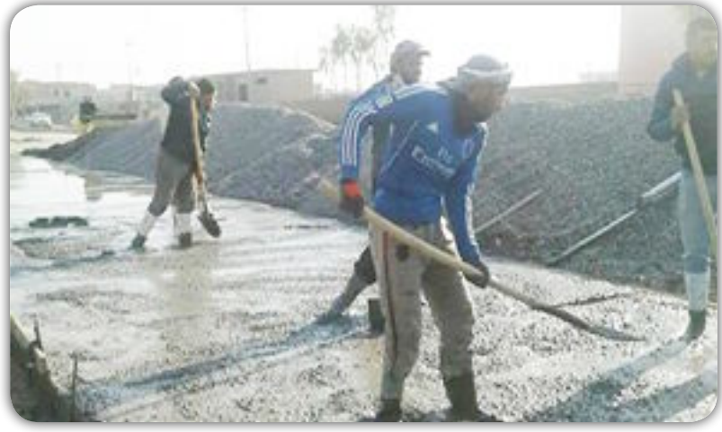
اعمال الصيانة شملت قشط الأسفلت القديم ومعالجة التخسفات والروطان والحفر وفرش السبيس ورشة وحده الجزرات الوسطية وزراعتها وإنارة

اعلنت وزير الاعمار والاسكان والبلديات والاشغال العامة د. المهندس أن نافع اوسي المباشرة بتنفيذ حملات خدمية واسعة لإعادة تأهيل وصيانة العديد من الشوارع الرئيسية في اقصية ونواحي محافظة نينوى ، ضمن تخصيصات صندوق إعادة الاعمار المناطق المحررة ونكرت السيدة الوزير ان مديرية بلديات نينوى التابعة لمديرية البلديات العامة احدى تشكيلات الوزارة باشرت بتأهيل وصيانة وإكساء العديد من الشوارع الرئيسية في الأقصية والنواحي الجنوبية لمحافظة نينوى التي تضررت ودمرت بفعل العمليات الإرهابية والعمليات العسكرية والتي شملت شوارع ( قضاء القيارة - ناحية حمام العليل - ناحية الشورة واوضحت السيدة الوزير أن