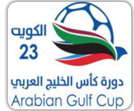
بقلم / أحمد المرواني