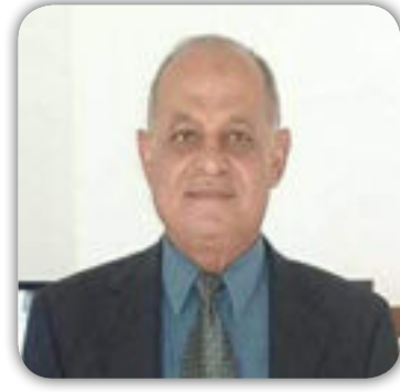
شعر / علي حسين علوان

بمناسبة ذكرى تاسيس الجيش العراقي الباسل يا سيد التاريخ حاضرنا هوى فانفض غبار البأس عن وجه المنى جيش العراق لك القلوب تزامت تهديك نبضا للهُتاف ولا انحنى ارض العراق من الدماء سقيتها إن مَرِّ باغ فيه تحرقه السنَا إن المهابة للسنُوف اصولها جيش المفاخر إذا تعانقنا الدنا هي كالجبال اذا السيول تزامت في سفحها لولا تلود من الفنا زجمرت لوناداك شبر داسه قدم الغزاة فقلت إنى ها هنا يامن رسمت النصر في هامانتا تاجاً وترفعه الاكف بهامنا