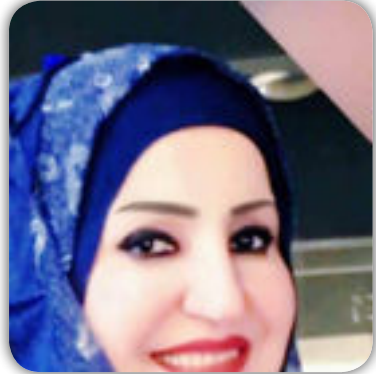
أنتك تنوء عن قبيلتي

فلا تسدي الي ، المدبيل...! ووحدي ، تموت معي ، جذوة تخلص مريرة في التصاق دموع الشوق ، في لبليل محرابي لا أدري أينما يذوب ، في نعت الأخر بالحبيب أنا وبكل ماتكته ، خراطج جنونك على صفحات فيروزي وهي تهم ، بالعلاء ، أغرقت معك ، في سبيل البقاء ومع تكهينات المزايا وهي لاتكف ، عن أحضان آمال حري .