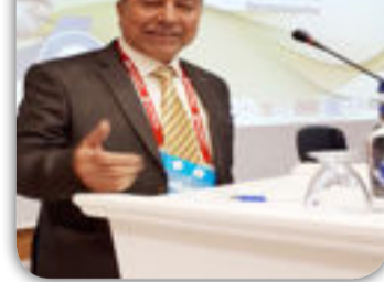
بِقلم / الدكتور سالم هوبي وحيد

تمثل الأسرة الوحدة الاساسية التي يقوم عليها المجتمع وعلى الصورة التي تكون عليها الأسرة من القوة او الضعف يكون المجتمع . فالأسرة هي الوحدة الاجتماعية الصغرى للمجتمع واي تغير يحدث في النظم الاجتماعية الأخرى مثل النظام الاقتصادي او السياسي او الديني او التربوي او الصناعي فانه يؤثر حتما فيها . فتعتبر بذلك الأسرة نواه اساسية لكل اشكال الجماعة في الحضارة الإنسانية بعمومها بل ان المهمة الاساسية للخلق باعتبارها قضاء الاهيا تتحقق بتكوين الاسرة من ادم وحواء بسم الله الرحمن الرحيم " يا ايها الناس اتقوا ربكم الذي خلقكم من نفس واحدة وخلق منها زوجها وبث فيها رجالا كثيرا ونساء واتقوا الله الذي تسعون به والارحام ان الله كان حلِيمًا رَقِيبًا " ولكي يتم الاستخلاف في الارض (اني جاعل في الارض خليفة ) ، ولكي يتم التعارف ( وجعلناكم شعوبا وقبائل لتعارفوا ) ، ومن ثم ينشأ العمران ( هو انشاك من الارض واستعمركم فيها ) .