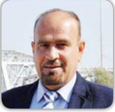
بِقلم / ظافر قاسم آل نوفة