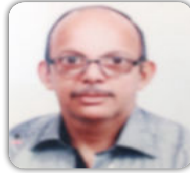
بِقلم / علي مصلح عباس

بصورة رئيسية هي عدم الانسجام في الفكر والاراء بين الزوجين، فعندما يضع الزوج تصوره بخصوص امر ما، يكون لا ينسجم مع رؤية الزوجة، هذين الامرين يؤديان في النهاية الى الكثير من الخلافات والنقاشات التي قد تتحول الى حرب فكرية عالية المغزى في البدء، فهذا يرغب بتغيير تلك وتلك الامر ان يكون الخلاف صامتا، عندها يجب ان ندرك ان الامر سينتهي الى الانفصال، فهذا الصمت يخلف وراءه الكثير من الالام والكثير من المعاناة، والتي لن تظهر كما كانت سابقا بصورتها العلنية الا عند الانفصال. السبب الثاني الملل والروتين : عندما تنتهي العلاقة بين الزوج والزوجة الى ان تكون كعلاقة زملاء في السكن، ويتقاسمون ايجار السكن والمصرف الاولاد عندها يكون قد وصل الطرفان الى اكثر من نصف الطريق الى النهاية، فلا هذا سيكمل ولا هذا يرغب بالاكتمال، وان اكملوا فيكون هذا الامر على حساب الابعاد النفسية والعاطفية، ففعليا الطلاق حاصل، ولكن بدون كلام حفاظا على الشكل الخارجي للزوج ان كان امام الابناء او كان امام الاخرين، فالروتين من اهم الاسباب والفروقات التي تقتل جسد مؤسسة الزواج بالعلل ويؤدي بالنتيجة الى الانفصال الحتمي، والاصل ان يبحث الزوجان في كل فترة وفترة عما يحيي هذا الزواج وينعشه، ويبعده عن حالة الملل والروتين، عن طريق التجديد والجنسي : وهو من اخطر الاسباب التي تجتاح معظم الأزواج، الا قلة ما، فبعد فترة من الزواج يصيب احد اطراف الزواج او كلاهما حالة