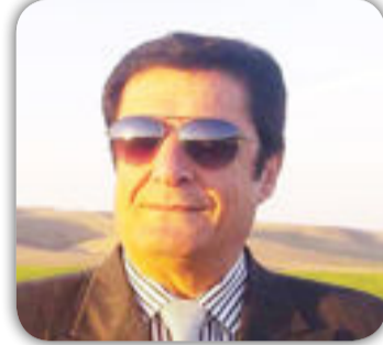
بِقلم / يوسف زكنكه

تهاجر احلامي صوب الافق بأجنحة مكسورة تعانق الظلام وتمر فوق المدن المهجورة تعارذ اشباح اليأس وتحطم الأقوال المأثورة لماذا نحيا ؟؟؟؟؟؟؟؟؟ لماذا نعيش ؟؟؟؟؟؟؟؟؟ لماذا نشوه للحب صورة أسئلة حقتي على سفاه صعاليك المعمورة هكذا تدور أحلامي الجريحة كما الأرض تدور == تبحث عن شيء مجهول عن أسم فقدت ذاتها أو عن ذات فقدت أسمها تبحث عن معلومة تمرقت من قاموس الحياة عن امرأة تسكن الأمي لتبحث مع أحلامي عن الشيء المجهول هل هو === الحب ؟؟؟ أم هي == السعادة ؟؟؟ التي بحثت عنها سني عمري الماضي لقد تعبت من السفر في سفن الخيال لذلك كنت أنسى لقائي الأخير مع حبيبتي والتي حكمت على (الحب == والسعادة) بالأعدام شنقا حتى === الموت ===