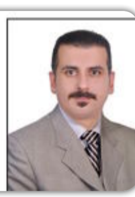
الكاتب / أحمد مالية