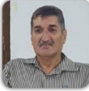
الشاعر / أمير الحلاج

من نار سياط الحروب المتسللة ، وهي كرة ، في محيط دائرة تدور ، نعكس الحال كلما حرت الجدل،