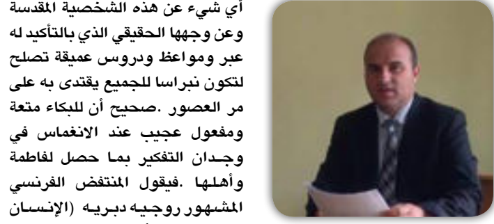
بقلم / منعم الزهيري

أي شيء عن هذه الشخصية المقدسة وعن وجهها الحقيقي الذي بالتأكيد له عبر ومواعظ ودروس عميقة تصلح لتكون نبراسا للجميع يقتدى به على مر العصور. صحيح أن للبكاء متعة ومفعول عجيب عند الانغماس في وجدان التفكير بما حصل لفاطمة وأهلها. فيقول المنتفض الفرنسي المشهور روجيه دبريه (الإنسان الذي لا يبكي أبدا ولا يعرف البكاء فاقد للشعور الإنساني) ... ولكن في نفس الوقت ماذا يمكن أن نتعلم من المدرسة الفاطمية وخصوصا النساء. فيعد رحيل النبي صلى الله عليه وآله فحدث لفاطمة ما حدث. وذهبت بعيدا خارج حدود المدينة في أزقة الفقراء و ركنت نفسها وعاشت في كوخها البسيط ليكون بيتا للأحران وهي تقضي بقية أيام عمرها القصير بالنواح والبكاء... وأي تراجيديا هذه فإنها بنت رسول الله أنها أم أبيها وزوجة أمير المؤمنين وأم الحسن والحسين وهي فريدة في بيت الغربية والأحران تصارع وتقاوم لوحدها وظلم الجائرين ولا أنيس لها سوى أيتها وبكاتها . أي صبر هذا ؟ وأي فكر هذا ... أنها فاطمة وبهذا استطاعت فاطمة ان تجيب على التساؤل المخيف . كيف يمكن لنا التحول ؟ وعلين أيتها النسوة وفي كل بقاع العالم وممن يتحفن عن الإجابة . فلا ترهقن أنفسكن بالبحث كثيرا . لان جوابكم هو فاطمة ..