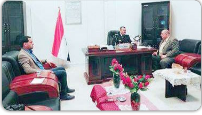
المحمداوي يزور قسم مديريةية تربية الزبير

خصصت دائرة مرور الحسينية في بغداد منفذا للمراجعين من ذوي الشهداء وذلك لتسهيل اعباء المراجعة . وهو ثمرة تنسيق مشترك بين مديريةية شهداء الكرخ ومدير دائرة المرور العقيد الحقوقي حاتم كريم احمد وأكد مدير مرور الحسينية إن جميع الجهود تبذل من أجل تسهيل الأعباء على المراجعين وبشكل خاص شريحة ذوي الشهداء لما قدمته من أجل نصرة هذا البلد وتحرير أراضيه من دنس البعث وأذنابه من الإرهابيين