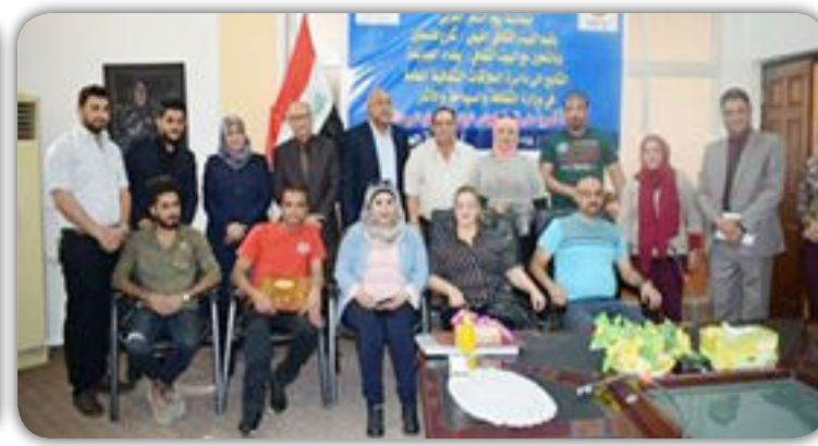
اقام البيتان الثقافيان الفيلي وبغداد الجديدة مهرجاناً شعرياً على قاعة البيت الفيلي في يوم الثلاثاء ٢٧ آذار متابعة : عبدالرضا القريشي طباعة : ايمان رزاق عبدي