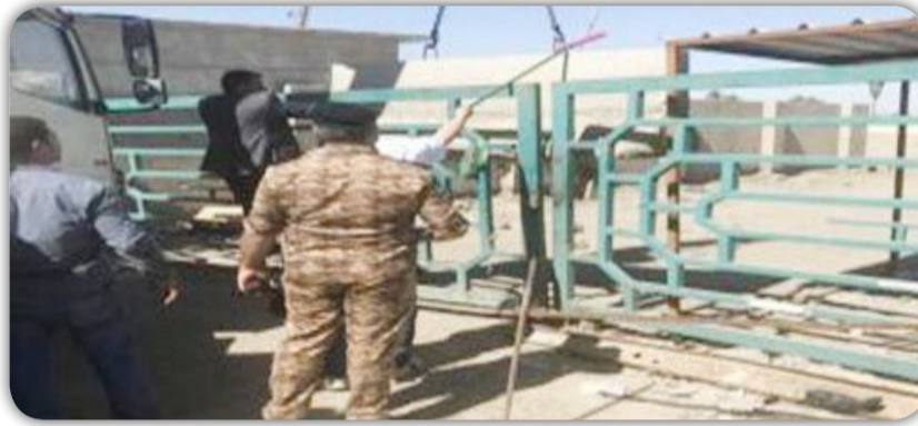
العراق الاخبارية / منى خضير عباس اعلنت الشركة العامة لادارة النقل الخاص ، عن غلق الممرات الغير نظامية لمنع التجاوز على مرآب البراق التابع لقسم الكرخ الشمالي. وقال مدير عام الشركة السيد عبد العظيم الساعدي انه تنفيذاً لتوجيهات وزير النقل السيد كاظم فنجان الحمادي وتلبية لنداءات عديدة وردت الى الشركة العامة لادارة النقل الخاص بخصوص التجاوز على الساحة الملحقة بمرآب البراق التابع لقسم الكرخ الشمالي قامت مغازر الشركة بغلق الممرات الغير نظامية للساحة وضمتها الى المرآب النظامي . وتابع الساعدي : تعد مثل هكذا تجاوزات خروقات بحق أنظمة

النقل الخاص والتي من شأنها ان تسبب زحامات واختناقات مرورية تؤثر سلباً على حركة المرور في العاصمة مشيراً الى ان ادارة الشركة سارعت بتلبية نداءات المواطنين من اجل الحد من تلك الظواهر السلبية.