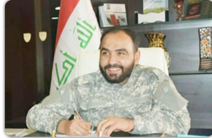
بقلم /كاظم حسين

الإسلام دين يقوم على الكرم والبطولة؛ لذلك وصف الله أنبياءه بالكرم والجود، فقال تعالى: ﴿ إِنَّهُ لَقَوْلُ رَسُولٍ كَرِيمٍ (٤٠) وَمَا هُوَ بِقَوْلِ شَاعِرٍ قَلِيلًا مَا تُؤْمِنُونَ ﴾ [الحاقة: ٤٠، ٤١]. فكان وصف الله تعالى له بالكرم دون غيره من أخلاقه العظيمة؛ لأن كل تلك الأخلاق مندرجة فيه، فأخلاقه كلها عظيمة كريمة، قائمة على الكرم والبذل والسخاء، وهو ما كان معروفاً به من قبل أن يأتيه وحي السماء. الإصرار وتأخذ بأيديهم