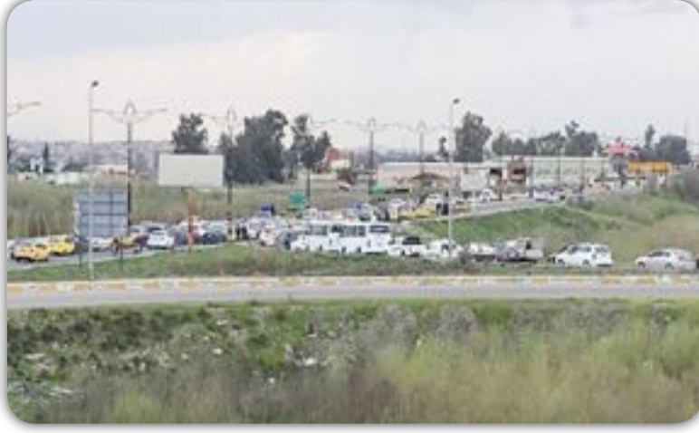
الموصل / شامل يونس

لفصل الربيع طقوسه الخاصة عند العراقيين عامة والموصل خاصة