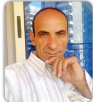
شعر : أشرف محمد قاسم

لا تمسحي فكيك من برهان قلتي يا ملاكي الأثمة فغدا... سيدخرنا الزمان "مقيم عشق التي غدرت به سفكت بلا نذب دمه !!! (٩) لا نزعري شيء بسيط قلب أحبك مخلصا فاغتاله الصمت ال يغلفه الضباب !!! (٦) صمتي كلام فلتقري صمتي لينصل الوثام !!! (٧) عجب .. عجب أن فتحي باب المنى للأدعياء وتغلقي في وجه من يهواك صدقا ألف باب !!! (٨) هذا دمي (٤) مطر . مطر والليل حولي صامت الأركان غلفه الحذر عيناك ما عادت تجي إلي في وقت السحر سفر . سفر وأنا يعذبني السفر !!! (٥) طال الغياب وأنا أفتش عنك في ليل ساما وضيق !! (٢) هل تدريين ؟ أن ابتسامتك الجميلة تنبت الأزهار في صخر السنين ؟ (٣) وحدي أحاور غريبي ويداك تعبت في جيوبي كي تفتش عن دليل خيانتني !!