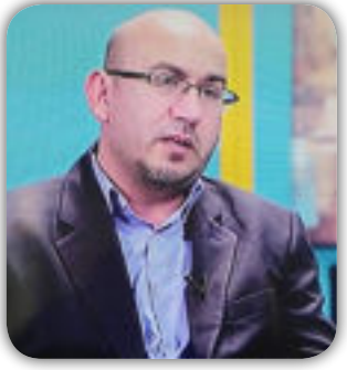
بقلم : سامر المعاني

معنونة جميعها باردة دون غيث غير التي اسماها الحب . ((( لقد رماني من شرفة احلامي ))) حين يصبح الروائي منقبا عن اثر المادّة الروائية فعليه ان يخرج من عبات السرد المباشر والمفردة الصريحة في كافة العمل فنجد ان دقة اختيار المفردة عند السمان بين التقيض والمفارقة ترتقي بطرحها حول المفاهيم العامة للمصطلح الادبي في درجة وصف الحالة او تسميتها بعدد فلسفة حول الشك واليقين والشعور بين متناقض الفكرة والعمل بها وتقيض الحالة في الشخصية عبر الاحداث والوقت. الترابط والتماسك في النص الروائي عند السمان قيمة تضاف الى هذا المنجز الشمولي للعمل الروائي الذي يمتلك مقومات نجاح العمل السريدي من حيث اللغة والأسلوب والمضمون ففي حب وثنى (رواية من رحمها تلتقط رواية ) فنحن شواهد على هذا الكاتب الفيروزي المتمكن بلغته الشعرية العذبة واسمع الثقافة يحجر في حب وثنى كأديب شامل تجد عتبات الفصول ابواب شعرية وخواطر جريئة وانفعالات واحداث مرقمة لكل منها نكهة وذائقة جميلة ومدهشة بالإضافة للومضة والشذرة وهو القادر على تلوين لوحاته بمحسّنات اللغة من جناس وسجع وطباق وترادفات وتشبيهات وتشخيص وتجسيد وتمثيل وصور فنية عالية الحرفة رقيقة الشعور كما اقتباس الامثال والحكم والقول المأثور التي تخضع لعمالي الحدث والشخصية الروائية الناطقة من هنا نجد ان الشخصيات الثانوية ( ام فدوى - ابو خضر - مضر - ابو الوليد... ) لم تكن فقط اسماء تتعايش مع