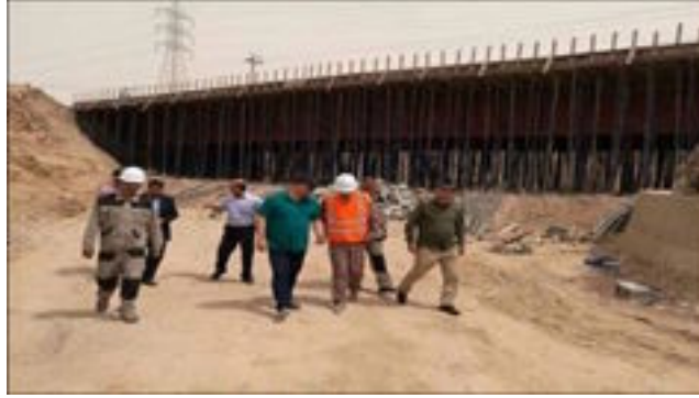
متقدمة ويسير بوتيرة متصاعدة حيث سيجري الأسبوع المقبل صب سطحه الجسر. وأضاف

من المؤمل أنجاز المشروع بالمدّة المحددة خلال الشهر المقبل. وتابع أن أنجاز هذا المشروع سيضيف الى المشاريع المنجزة والإنجازات التي حققتها الشركة خلال عامي ٢٠١٧ و ٢٠١٨. يشار الى أن جسر وادي العوسج من الجسور المهمة في محافظة ديالى ويربط المحافظة بأقليم كردستان وتنفذه شركة المعتصم وبأشراف دائرة الطرق والجسور التابعة للوزارة وتمويل من قرض البنك الدولي لإعادة أعمار المناطق المحررة.