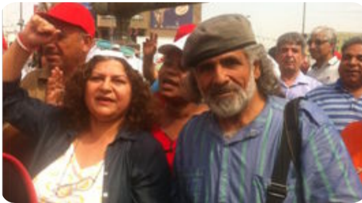
العراق الاخبارية / حمودي عبد غريب

انطلقت في تمام الساعة العاشرة من صباح الثلاثاء وسط بغداد من ساحة الصباح السحري وحتى ساحة الاندلس المسيرة العمالية التي نظمها اتحاد المجالس والنقابات العمالية في العراق بمشاركة الحزب الشيوعي العراقي ولجانته الثقافية والعمالية والرياضية والاعلامية بمناسبة عيد العمال العالمي الذي يحتفل به في الاول من ايار من كل عام في جميع انحاء العالم وقد عبر المشاركون عن فرحتهم بهذا اليوم الاغر الخالد وهم مبهجين بعيدهم هذا معبرين عن تطلعاتهم المستقبلية بايجاد الحلول الكفيلة واللائمة لحل البطالة في البلد ومنح فرص العمل لهم وتفعيل القوانين الخاصة بهم وتنظيم عملهم النقابي والمهني واعادة تشغيل المؤسسات الانتاجية المغلقة منذ سنوات طويلة لاسباب تعددت فيها عوامل الوضع الامني العام وتردي الوضع المالي والاقتصادي بشكل خاص .