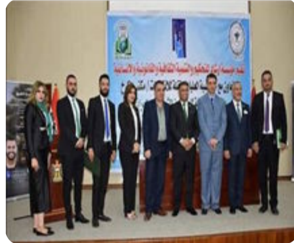
كتب: محمد رشيد الدفاعي