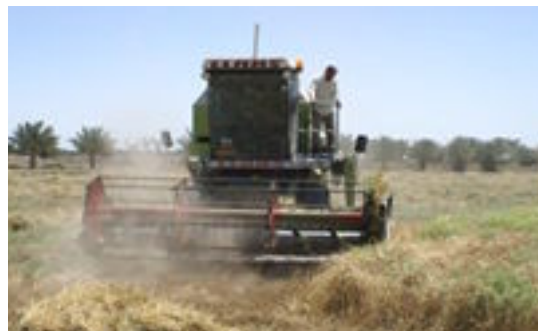
نظمت وزارة الزراعة / المثنى ندوة فلاحية بعنوان المركز الارشادي التوعوي في (تقليل الضائعات بعد حصاد

المحصول)، وبحضور عدد من الفلاحين والخبراء والمختصين في الشأن الزراعي. وجرى خلال الندوة عرض ومناقشة عدد من المحاور منها اهمية الحصاد الميكانيكي للمحصول، والارشادات والنصائح لتقليل الضائعات قبل واثناء الحصاد، واهم الاسباب المؤدية لحدوث الضائعات بالحصاد الميكانيكي، وتحديد الموعد المناسب للحصاد،