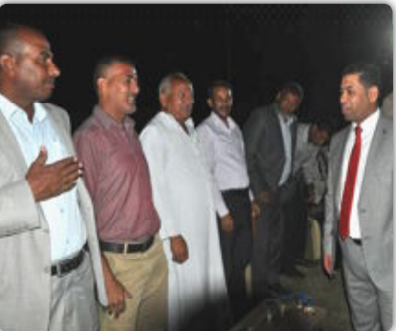
العراق الاخبارية / حيدر حسن هاشم

جموع غفيرة تتوافد لتقديم التهانى والتبريكات الى الأستاذ صادق مدلول السلطاني محافظ بابل لفوزه في الانتخابات البرلمانية لعام ٢٠١٨ متمنين له التوفيق والسداد في عمله والسير على نهجه في خدمة العراق بصورة عامة ومحافظه بابل بصورة خاصة .