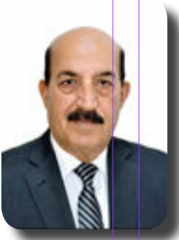
بقلم / جمال الربيعي

صناعة الأزمات من مهام رجال السياسة والمخابرات المحترقون الذين يجيدون فن الهاء الشعوب عن امور مهمة وذات مساس بحياتهم ومن أجل تمرير المخططات والسياسات المشبوهة أوجدوا غرفا خاصة لذلك تتبنى نشر الاكاذيب عبر شبكات اخبارية عالمية ويحشد لها مختصون لاضفاء صبغة المصداقية عليها ، وهنا يتداول الشعب تلك الاكاذيب وتأخذ منه اياما حتى تكون القضية التي ارادوا تمريرها قد اكتملت بنجاح .