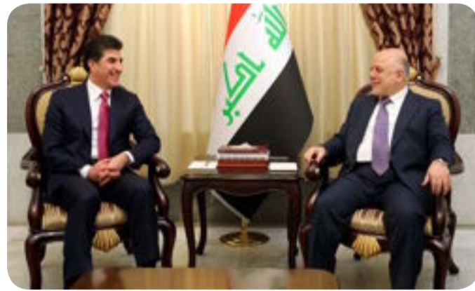
بحث رئيس الوزراء حيدر العبادي، مع البارزاني الأوضاع السياسية في البلد، فيما أكد الطرفان على أهمية التواصل

وتبادل الحوار بما يعزز العمل الوطني المشترك. وقال المكتب الاعلامي للعبادي إن رئيس الوزراء حيدر العبادي استقبل رئيس حكومة اقليم كردستان نيجرفان بارزاني وفؤاد حسين، وجرى خلال اللقاء مناقشة الأوضاع السياسية والعامه في البلد وبحث عدد من الملفات المشتركة بين الحكومة الاتحادية وحكومة اقليم كردستان بما يحقق وحدة ومصصلحة العراق. وأضاف المكتب، أن "اللقاء شهد تقارب وجهات النظر تجاه معالجة التحديات التي يواجهها البلد، والمرحلة المقبلة والسير قدما لتشكيل الحكومة القادمة بما يحقق مطالب الشعب العراقي في دعم الاقتصاد والاعمار وتقديم الخدمات وخلق فرص عمل".