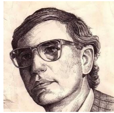
جلال زنا ابدي

ولذا لما تزل نواتي جمجمتي محفوفة بـ ○ صفحة + فرجال + مسطرة + منقلة + (المائة ن) (٢): "..... رجل نادى...مقل... فإنه سوف يُعدم" (٣) □ فنتنننن قصائدي؛ مادامت لا تلاثم ستائر المرحجانات والمؤامرات الزاهية ولنتننن الغياب في كل ما ليس أنا وفي خطي العنكبوت التي مانفتكت تزدرد تاريخ مستقبلي لعلها ترمد هوة عيني، في حضرة العيون المحتضرة، حيث تجرني أفتار الطواويس من كويكب ذاكري ولمؤن أحلامي؛ إمتحالا لسياسة وحش وصول ويجول بين فخذني بلادي المستباحة؛ حتى لا يبقى لقصيدي المستضعفة هذي سوى جبروت جبالي، رهبة رهائن محتشدة ومهاوي بصيصات سحيقة؛ فكيف، إنن، لا تستحيل لشاعر غير منتظر مثلي نهر هيراكليس في WC مستقبل لا = صرب باب أو وطنين ذبابية؛ × لربما لم يخطر على بالك قط يا مستقبلي المغفل أن سهيس لك / لي شبحي من كيف مرارة نائية؛ - ليتني تفهقة قراء بين هاويتين أو