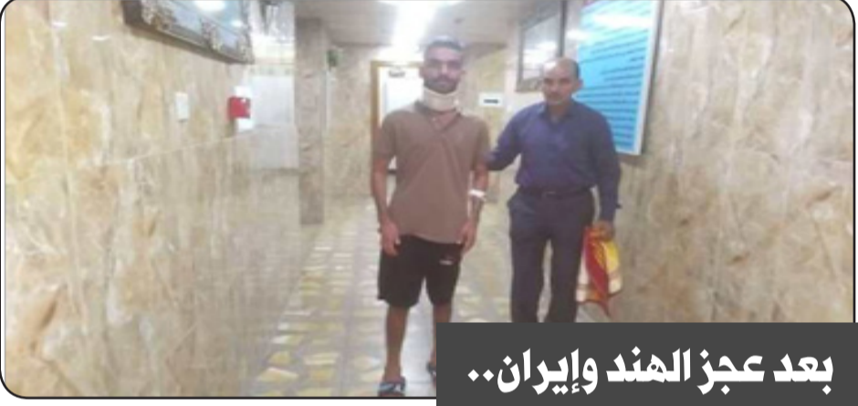
بعد عجز الهند وإيران..