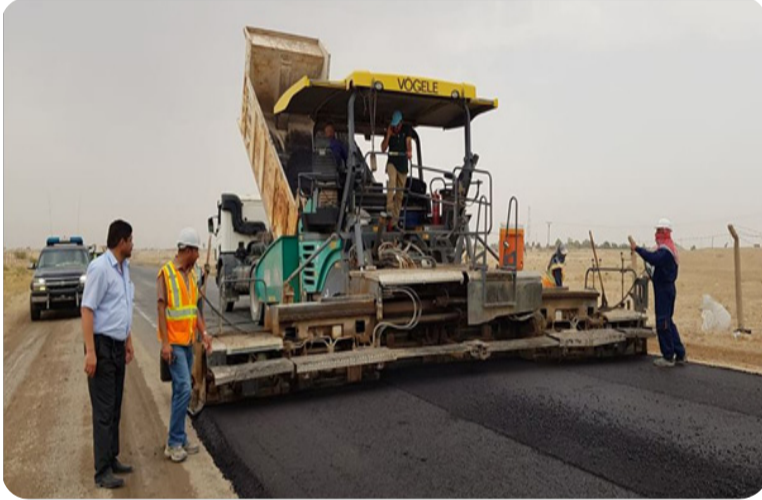
نهجها في خدمة العراق وابداء شعبنا الكريم ومشروع سامراء- دور- العلم في محافظة صلاح الدين من ضمن مشاريع