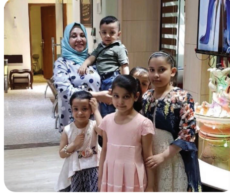
افتتاحنا للمركز .. هل تواجهون صعوبات في علمكم ؟

الحقيقة نحن كمركز لانتملي اي دعم من الدولة او اي جهة حكومية فكل مانقوم به هو جهود ذاتية بحثه كذلك نعاني من عدم تفهم الزوجين واستيعابهم لنسبة نجاح مثل هكذا عمليات التي هي ٦٠٪ في كل دول العالم ويستعملون النتيجة من اول محاولة ولا يتقبلون الفشل في المحاولة الاولى كذلك نعاني من المفاهيم الاجتماعية الخاطئة لدى البعض بعدم الافصاح باللجوء الى عمليات اطفال الانابيب لعواظهم وللمجتمع وخاصة الأزواج باعتبار ذلك حسب مفهومه انتقاص من رجولته . مامدى مواكبتم لآخر التطورات الطبية في مجال علمكم؟ نحرص يوما الحضور والمشاركة في المؤتمرات الدولية منها حضور مؤتمرات الجمعية الاوروبية للخصوبة وجمعية الشرق الاوسط للخصوبة والجمعية الامريكية ومؤتمرات الجمعية العراقية للخصوبة