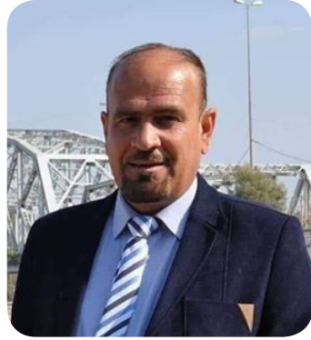
بقلم / زاهر قاسم آل نوفة

من مختلف النواحي للحصول على منهم اثنان احدهم يتابع كل ما اشره وبتناقش كل ما تسمح لنا الظروف من لقاء خاطف ، والأخر (مطنش) من يوم يومه يعني (مطفي) من بيبي أيامها ذهباً سويوا لشراء ملابس حسب موضه ذلك الوقت احدهم اشترى سيت ابيض بابيض يعني القميص والبنتلون وحتى الحذاء (أجلكم الله) ابيض وكان من نوع (روغان) بالمجمل كان أشبه ببطل حليب (أبو غريب) ، والأخر عكسه القميص مكتوب (ديسكو دنسر) بالانكليزية وكأنه بطل بيبي . اتفقا ان يذهبا عصر يوم صيفي إلى بعقوبة وتحديد شارع الأطباء لان هذا المكان يعتبر تجمع للشباب