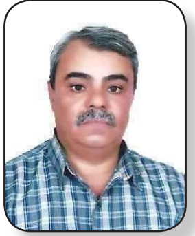
بقلم / أحمد المرواني