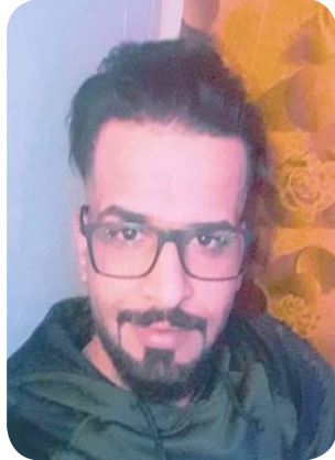
شعر / باسم الحربي

أحاول الإنتحار دائماً لاشيء يا اصدقائي فقط أحاول أن أكون ضحية متنايرة حتى الجور أحياناً يمزق جلدته الوقتي كي يقنح الكسارة أنه جورٌ مثابر .. هذا كل ما في الأمر . أنا يا حبيبتي مشغول جداً بترميم هذا العالم مقلاً أستيقظ في الفجر لألتقط ما تساقط من أفواه العابرين .. هي مفرداتٌ ربما لا تدل على شيء آخر . أرتبها على شكل لعناتٍ أو صور قديمي كبيرة جداً فالأرض ليست على مقاسي لا شيء يستوعبني أنا هائل يا صديقتي قطعة حلوى كأغنية لسيد مكاي فارتكيني أفرج بعيداً عن كوكبنا الصغير لعلي أجد حذاءً يناسب فكرتي .. يا الله أيها الفنان العظيم إن لوحتك الأخيرة شوهتها الحرب والعاشق الذي يقف أمام الشرفة بُرت ساقه اليمنى يا الله