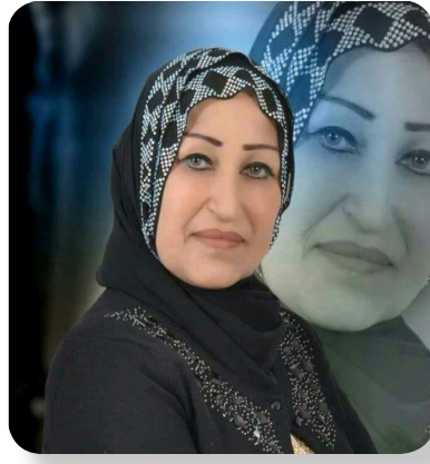
بقلم / انتصار الضلالي

المحبة والألفة ولا ننسى هنا المرأة العراقية المجاهدة الصابرة التي تعرضت كما تعرض اخوها الرجل نتيجة الاعمال الإرهابية للقتل والتهجير، ونالت حقها من هذا الاجرام الذي فتن بالمجتمع العراقي فسقطت ضحايا كثيرة منهن في اثناء تأدية واجباتهن في العمل او ما لحقهن نتيجة الإرهاب الاعمى وهن يقمن بتأدية مهام الحياة اليومية او من تاملن لفقدنهن ازواجهن بسبب تلك الاعمال الجبانة لذلك من الواجب الإنساني والأخلاقي النظر بأحوال تلك المجاهدات وان ينظر لهن ليس على أساس انهن جزء من هذا المجتمع بل على أساس انهن المجتمع بأكمله واعطاءها الدور الكبير في الحياة واستنكار التضحيات الكبيرة التي قدمتها العراقية لتكون طريقاً معبداً لها للوصول الى الحقوق الحقيقية التي