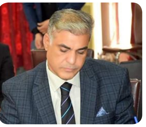
شعر / مازن جميل المناف

ماذا أقول وقد سقط الكلام على الجثث كالذباب؟ ما تنفع بكاء ودموع التكالأ ؟ موت حتمي ماقيمة الموت ان صار مشاعاً للجميع طارقاً كل الأبواب ؟ احلم .. ماهو الحلم ؟ من أين تأتي الصور وقد تشردت كل الأذهان واحرقت غابتي المتمردة في ذاتي يعود نقاب ارتحل أو أعيب عن مكان إلى مكان لتسكن روجي الغائبة الشاردة لأسافر في وسط الألام ، الجوع وعلى الجرح تسري الأسراب ماقيمة ذلك والساعات والدقائق والأيام انتهت إلى مجهول بخطى الاقدام إنا سيد الفشل والخوف والمأساة اعترف بذلك لأعيب في ذلك طالما ثمة عبث الأيام الحبلى والسكرى وثمة جراح وطعن الحراب هذا البقاء الأزلي على الأثر خراب خراب مادام هنالك بقايا القلوب المشوهة بالإحباط هذا فصل حريق ملتهب وحقيقة ليس سراب دقق بذلك ليس فصل خريف ضاعت النقاط واشتبهت بالحروف حريق ، خريف ، حريق ، خريف هذا أو ان انتشار المشاعر الزائفة وشيوها دون سؤال او تعبير عن اي جواب واختلاط الحروف بالجمال من أين يأتي متقدي الآن ومن أين ارتوي وقد تفتت كل القراب هذا التناقض الوحشي كيف يهدأ في روجي في زمن موت زغردة العصفير في الفجر الضبابي الأبيض المتلبد بالضباب وكل غاباتي المنعرة احترقت بعود نقاب .