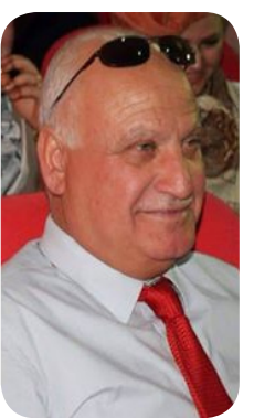
شعر / كريم الزبيدي

لم يكن حلماً... انه حلم خارق غير اعتيادي يمتص من جسدي حرارة الممل ويمسح من جبيني حبات الثلج البارد يأخذني حيث شلالات العرش تحمله النجوم نيكارا وطراقات الأمازون اتسلق افرست على نغمات بيتهوفن ويرسمي موناليزا بأنامل دافنشي لأصبح لساناً يمتد فوق شفتي شكسبير حلمنا سطر في جيكون وكل امرأة فيها حبيبة احلى قصائد السياب