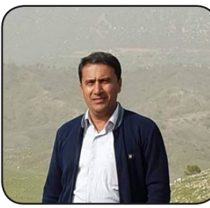
بقلم / اسماعيل خوشناو

لم بقي قيس في الحياة بلا مفر لا يعرف من أين هو إلى أين يقوده رَسْمُ القدر أنتهال عليه مآهات الصَّحاري أو يمسُّه الجنُّ من وحشة الكَرِّ والفَرِّ على رُقعة البراري نَقَّت كل أبواب المعاني حَصَّنَتْ كل رحيق الأزهار باليسير من النواني بعنبي أطلق سيلاً بلا نظر تجرف كل عُمرات تمنع قيساً من عُرس براهه لإكمال ديوان لوحة تحقّق السعادة وتلدّ جيلاً متفانلاً من الأمانى حتى لوحات العَجْر على باطن كَفِّ سأمسحها