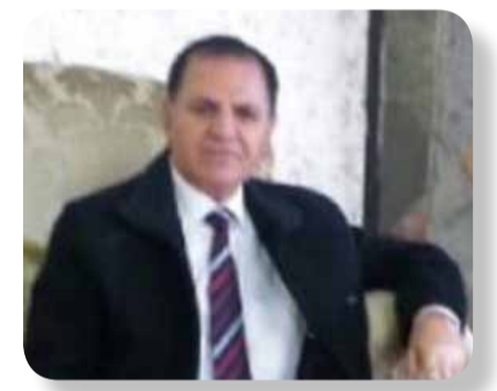
شعر / محسن آواره ترجمة / محترم محمد

أطفأوا غرسَ للحب ، نك الإنسان حصاناً للتعظيم هذموا لا أعلم معارب الوصل بأي خيط الآن و أي مخرَّب أو إبرة الهاتف مُغلقُ أخطبُ العزيرة جغرافية كردستان على جمر المجهول المخرَّبة تتلو وكيف أفرق تتابع في شوق بين الهاتف المغلقُ عسارة الدفلى × كم أنت فائقة في شهد القفير × الرقعة حين تطلِّين مرساتي ترتب يختل ميزاني و حتى إتراني تُرصني أجزاءي يُخف مثل الريش كي وقاري كي و كيانى أعود كما كنتُ × بمامة بيضاء مثل الطلح شبهه لم يكنْ أهلاً الحليب كي تلك الوردة على صدره تقلدُ إنتحبت الوردة سُور شريف الحربُ إلتهمت إستمحاح الصدرُ مُدَّفاً × في هذا الليل المتأخر × من يوصلني لحنه أطفئ النبراس إذ عودي لذاتك عودي لذاتك مُستقر داني وفري النور والأنفاق لن تنتهي هناك × يُشرع حنايا الصدر لو تكوني نسمة لو تحرري سحابة لو تحرري سحابة الطرَّ بالزخات كم يَضُم خاقي × من فراق يغرُّ النافذة ومن إحتراق يُقدِّم لك الإمتنان × أزيز الرصاص القطارُ ذاك × صياح فرسان الأمبر × سحب كل العرابت كما وقفت × أنا الوحيدُ أنا الوحيدُ × أطفال القرية ترى × جاء الدُور ألم يُصنُّ أساريري × على بقرة الأسرة ألم أكن × على السكَّة كما أمرتُ × كي تقطع حلمات ضرعها × صادروا × الأربع . الهاتف المحمول