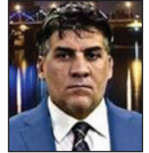
بقلم / حسين المطيري