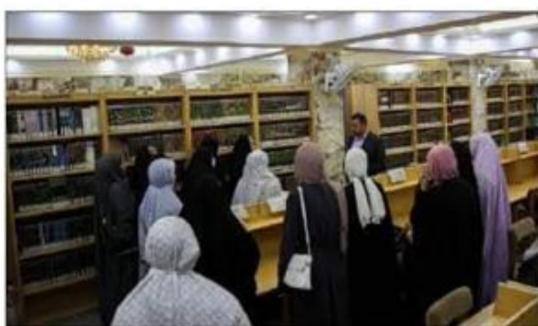
إخراج القطعة وإرجاعها الى مكانها المخصص.

متحف الكفيل للنفائس والمخطوطات يعد الاهتمام بالوثائق الحضارية والتراث الإسلامي والتراثي، بمثابة حماية وحفاظ على الجامع الحضاري والثقافي والتراثي والادبي، التي تروى ماضي الامم والحضارات والشعوب التي يؤسس الهوية الوطنية، لما يمتلكه التراث بمختلف تصنيفاته والنوع، من قيم ثقافية ومعرفية وجمالية وسياحية في حياة الشعوب والامم السابقة، والذي ينشر الثقافة والفكر والعرفان من خلال المتاحف والمؤسسات الثقافية والادبية الى الازدياد.