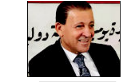
عبدالرسول زيارة الاسدي

حين نقف أمام قامته وطنية مشرقة مثل معالي وزير الداخلية الأستاذ عبد الأمير الشمري فإن أول ما ينتصب أمام أعيننا هو تلك السيرة المثمرة لرجل أفنى أعوام عمره للمدينة في خدمة الوطن والدفاع عن مواطنيه في كافة المناصب التي شغلها وكلها جديرة بالإهتمام. بل أن الحديث عن تلك المنغطفات الصعبة التي خاض غمارها في الدفاع ضد فلول الإرهاب والجريمة تستلزم صفحات طويلة لأنها تعيد إلى الأذهان أسطورة الرجل الوطني المقدم الذي لا يهاب الأعداء في ملحمة طويلة من مقارعة عصابات الإرهاب والجريمة وخوض ملاحم الشرف من أجل أن يكون العراق حراً أبياً مصاناً. رحلة هذا الصنيد تمتد بنا إلى أعوام طويلة سبقت عام ٢٠٠٢ كان فيها ضابطاً في الجيش العراقي ليتدرب في صفوف المسؤولية وصولاً إلى أن قيادة الفرقة العاشرة ثم قائداً لعمليات بغداد في واحدة من أصعب المراحل في تاريخ البلاد في الفترة من عام ٢٠١١ إلى عام ٢٠١٦ خاض فيها أروع الأدوار في مقارعة تنظيم داعش الإرهابي حتى أشير إليه بالبنان واستحق أرفع الأوسمة من دول العالم ومنها وسام (جوقة الشرف) من فرنسا لدوره البطولي في التصدي للإرهاب. وتستمر السيرة المشرقة بكل ما تتضمنه من عطاء ومسؤولية ودراية وقدرته على التحلي بالصبر وصياغة تفاصيل مشرقة لغدنا الذي حلمنا به طويلاً ووجدناه يصاغ على يد القادة الأفاضل في مؤسستنا الأمنية التي تستحق منا الكثير من العرفان.