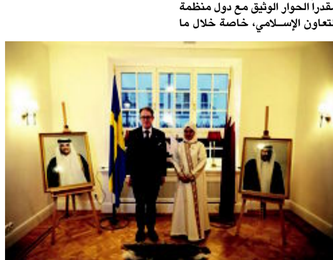
ومن جانبه، توجه سعادة السيد بيلستروم، بالشكر على دعوته للمشاركة في الإفطار الرمضاني، وأشار إلى أننا محظوظين حيث تمكننا من المشاركة في هذا الإفطار في مكان آمن، معتبرا ان ذلك تكبير بالذنين لا يتمتعون بالأمن والسلام، خاصة في قطاع غزة حيث ليس لديهم طعام او الامكان اللازمة لتلقيهم إليها. موضعا بأن العديد من المدنيين الأبرياء قضوا في الحرب، وذلك يؤثر تساؤلات حول إحترام القانون الدولي وحقوق الإنسان، مشيراً أن بلاده قد رفعت من مساعداتها لقطاع غزة بأكثر من ٣ مليون يورو، و٢٠ مليون كرون سويدي للأونروا، وأضاف، بأن

أقامت سعادة السيدة نادية بنت احمد الشيبني- سفيرة دولة قطر لدى مملكة السويد، مائدة إفطار رمضانية على شرف سعادة السيد توبياس بيلستروم- وزير خارجية مملكة السويد، بحضور أصحاب السعادة سفراء وممثلي دول منظمة التعاون الإسلامي المعتمدين لدى ستوكهولم، إلى جانب عدد من الشخصيات السويدية، وذلك يوم الخميس الموافق ١٤ مارس ٢٠٢٤م. رحبت سعادة السفيرة الشيبني، بالحضور وأعربت عن تقديرها للسويد لإستئناف المساعدات لوكالة الأونروا، مباركة إنضمام السويد إلى حلف الناتو، وأشارت إلى أهمية هذه الخطوات في دعم السلام والاستقرار العالمي، وكما تطرقت إلى أهمية الصيام في شهر رمضان والقيم المشتركة بين الأديان والثقافات المختلفة، مؤكدة على الدور الجماعي للعمل الإنساني والتزام دولة قطر بدعم مبادرات إضال المساعدات الإنسانية إلى غزة. وفي ختام كلمتها، دعيت سعادة السفيرة / الشيبني، الحضور للتأمل في الأزمة الإنسانية التي يواجهها الأشقاء الفلسطينيين في قطاع غزة وأهمية التضامن والعمل المشترك لمساعدة المحتاجين. متمنية للجميع إفطارًا مباركًا وأمسية مليئة بالتواصل الهادف، معربة عن تقديرها للجهد المبذول في المحادثات الدبلوماسية وتطوير العلاقات القطرية السويدية.