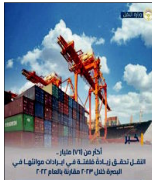
النقل تحقق زيادةً مُلفتةً في إيرادات موانئها في البصرة خلال ٢٠٢٣ مقارنةً بالعام ٢٠٢٢

حققت الشركة العامة لموانئ العراق (إحدى تشكيلات وزارة النقل) زيادةً مُلفتةً في إيراداتها المالية خلال العام ٢٠٢٣ مقارنةً بالعام الذي سبقه ٢٠٢٢ .