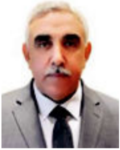
السفير الدكتور أحمد نايف الدليمي نموذجاً بقلم / مراقب في الشأن الدبلوماسي

تعدّ الدبلوماسية العراقية واحدة من أعرق وأقدم الدبلوماسيات العربية بل والإقليمية في المنطقة وهذا التاريخ الطويل تجلّى بالعديد من القضايا والأحداث التاريخية والسياسية والإنجازات المهمة التي من شأنها الارتقاء بهذا المفصل نحو الأفضل وبما يتحور من حراك دبلوماسي عراقي لإنجاح قضاياها المصرية ومحاولة الحفاظ على وحدة وسيادة البلد من التداخلات الخارجية وتعزيز الثقة مع الأطراف الإقليمية كون العراق يشكل نقطة تحول وارتكاز جيوسياسية في المنطقة بسبب موقعه الجغرافي.