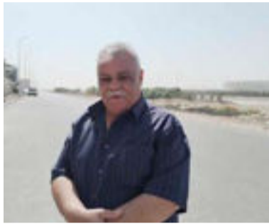
متابعة / احمد الروائي

بهدفين مقابل لا شيء اما الشرطة ففاز هو الآخر على نطف البصرة بهدف دون رد لبقية فرق النقاط الخمسة قائم وبات اللقب قريبا من نادي الشرطة وان حصل فهو اللقب الثالث على التوالي وهو انجاز كبير وفريد لنادي الشرطة. ففي هناك ثلاث مباريات لكل فريق وجهاه الفريقين متربصين لكل لقاء للشرطة ومثله للجوية فتعذر أحدهما يعني إعطاء فرصة للأخر فطريق الشرطة يكاد ان يكون أصعب من طريق الجوية لما تنبغى من المباريات ان انه سيخوض (الشرطة) لقاءات مع فريق النجف بلعب الأخير وله لقاء يدربي مع الزوراء فضلا عن نادي دهوك ولقاءات الجوية هي أبريل في بغداد والقاسم بلعب القاسم ونطف الوسط في بغداد ورغم سهولة هذه المباريات التي سيخوضها الجوية الا ان كرة القدم هي أم المفاجآت فالأمر مفروق للمستطيل الأخضر ولا احد يتمكن من التكنن بمن هو بطل الدوري لهذا الموسم حتى انتهاء الأدوار الثلاثة الأخيرة فالمتصدر متصدر لهذا الموسم فبالأسف فاز الجوية على نادي الامانة