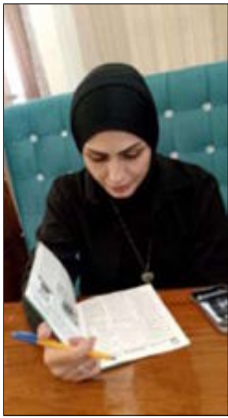
بقلم / درر حسن

إننا في عملية الارتقاء هذه سوف يبقى الإمام الحسين - عليه السلام - المثل الأعلى الذي نسعى نحوه، لأن الحسين كان عظيماً عذابها ومظلوميتها. فلا يستغرب أحد إذا كانت مكانة الحسين عند الله - سبحانه - مكانة خاصة وفريدة لأن الموقف الذي كان له في عاشوراء ليس له مثل في التاريخ قديماً وحديثاً.