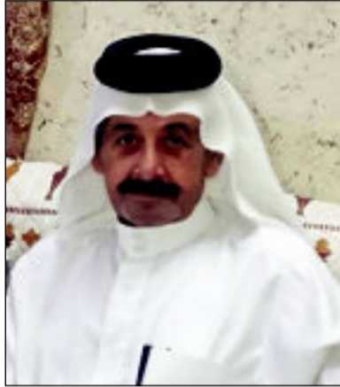
علي صحن عبدالعزیز

أنتهيار المنظومة الاجتماعية صفاء الدين البلداوي : صناعة الوعي وبناء الإنسان يرتبط بمقومات ومعايير لا يمكن الإفراط بها لبناء جيل واعد متسامح ثقافياً ودينيًا وإجتماعياً منعها الأخلاق والبعد الإنساني ، وبما أن مجتمعنا العراقي قد تعرض لهزات قاتلة ومتعاقبة من الحروب التي خلفت الفساد والجوع والفقر وشيوع الجريمة بكل أنواعها