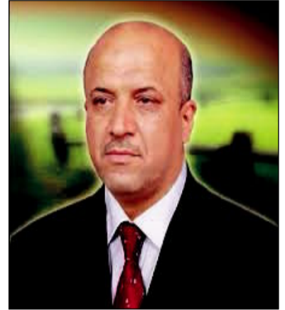
تحقيق / علي صحن عبدالعزیز

صفاء الدين البلداوي : مجتمعنا العراقي تعرض لهزات قاتلة ومتعاقبة منها الجريمة بكل أنواعها .