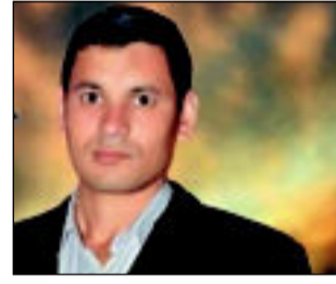
لن ينتزع المجرم ابدنا هذا الحب من بيروت والحدق الهمجي سيرحل

تناديني « أنا قطوفك الدانية أنا غيمتك الممطرة