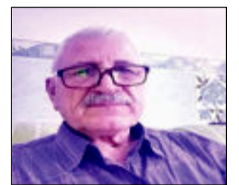
قالنا... قلت :