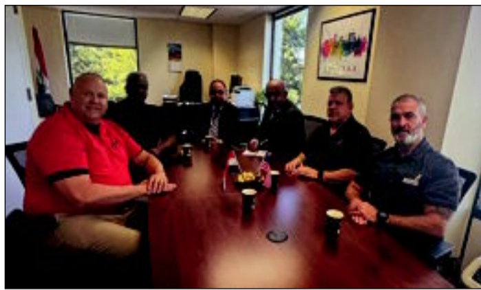
هي الخطوات اللاحقة التي يجب العمل عليها ليمتد بناء خطوط تجميع للشاحنات داخل العراق . وأضاف البيان ان الاجتماع بحث كذلك

ناقشت دائرة العلاقات الاقتصادية الخارجية ممثلة بممثلة تجاريتها التجارية في واشنطن مع ممثلي شركة MACK الأمريكية للشاحنات سبل التعاون وتوسيع العلاقات الاقتصادية والتجارية بين العراق والولايات المتحدة الأمريكية ، وخصوصاً ما يتعلق بنقل التكنولوجيا الأمريكية الى العراق وبحضور المحقق العسكري . ونقل بيان المكتب الإعلامي للوزارة عن مدير عام الدائرة رياض الهاشمي ان الاجتماع استعرض آخر التطورات الخاصة بتنفيذ مذكرة التفاهم التي تم توقيع عليها بين الشركة والصندوق العراقي للتنمية ، وما